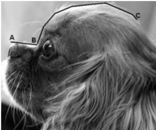
Abb. 2 Verhältnis Schnauzen-/Schädel länge (aus Packer, 2014: S. 18)

Schnauzenlänge (Nasenspiegel bis Stopp) in mm X 100 = Schädel länge (Stopp bis Kante Hinterkopf) in mm _____